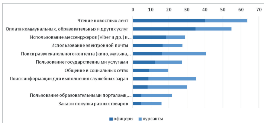
Рис. 2. Структура использования возможностей интернет-ресурсов курсантами и офицерами (в % от числа опрошенных, представлены ответы тех респондентов, кто использует предложенные возможности часто)

Из разных областей интернет-технологий респонденты больше всего нуждаются в совершенствовании навыков использования антивирусных программ и защиты личных данных, хранящихся в Интернете, 63 % офицеров и 78 % курсантов хотели бы улучшить свои навыки в области информационной безопасности. При этом только 60% офицеров регулярно обновляют антивирусные программы, 37% меняют пароли от электронной почты и банковских приложений, каждый второй использует разные и сложные пароли для разных сайтов, каждый пятый использует программы родительского контроля активности детей в Интернете. Курсанты более ответственно подходят к интернет-безопасности, каждый второй регулярно меняет пароли использует уникальные и надежные пароли для разных интернет-ресурсов.