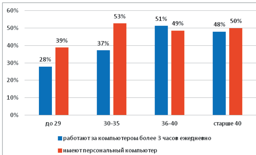
Рис. 1. Особенности пользовательской активности офицеров разных возрастов (в % от числа опрошенных)

Сопоставление результатов опроса с данными российских исследователей подтверждает цифровое неравенство социально-профессиональной группы военнослужащих в российском обществе. По данным ВЦИОМ в 2019 г. 50% россиян возрастных категорий от 25 до 60 лет пользовались Интернетом менее четырех часов ежедневно [Жизнь без Интернета URL]. Аналогичный показатель у офицеров – 84%. Еще более впечатляющий цифровой разрыв наблюдается между курсантами и студентами: по данным исследования Р.М. Петруновой только 12% студентов пользуются компьютерными устройствами менее двух часов в день, при этом большинство опрошенных студентов успевают пользоваться мобильными устройствами на учебных занятиях в университете [Петрунева Р., Васильева, Петрунева Ю. 2019]. Наше исследование показало, что 93% курсантов пользуются интернет-ресурсами менее двух часов в день, а использование мобильных цифровых устройств на учебных занятиях строго запрещено. В условиях отсутствия мобильного Интернета, половина курсантов регулярно пользуется ресурсами электронно-библиотечной системы, и всего 15% регулярно посещают интернет-классы.