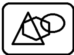
Рис. 1. Название рисунка

В случае, если приводится таблица, то слово «таблица», выделенное курсивом, располагается справа относительно центра страницы, а название таблицы, выделенное жирным шрифтом, помещается по центру относительно приводимой таблицы, например: